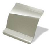
D11 - Beige Pimienta