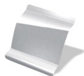
KNH - Gris Estrella