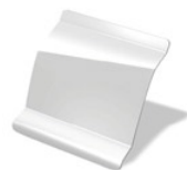
369 - Blanco Glaciar