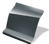
266 - Gris Acero