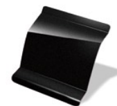
676 - Negro Nacré